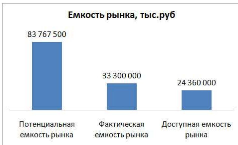
Рис. 1. Ёмкости рынка

Из графика видно, что рынок обладает большим потенциалом роста и не используется компаниями максимально полно. Для данного рынка необходимо проведение образовательных кампаний и рекламных акций по привлечению неохваченной аудитории и формирования более частого использования товара.